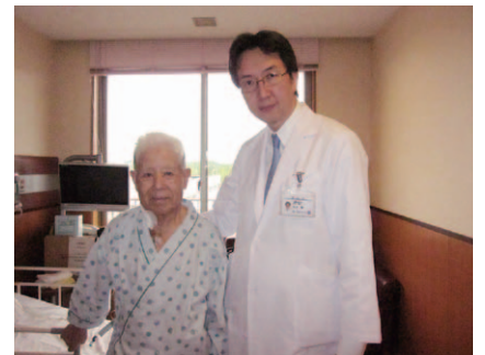
弓部大動脈全置換術の翌日に病棟で歩行している85歳の患者様。最高難易度の手術でも超早期回復でお応えします。

また、より低侵襲な手術としてステントグラフト挿入術があります。これは通常の手術のように開腹や開胸をせずに、カテーテルで内側から瘤をなおす治療です。当院でも2009年からステントグラフト治療を開始し、症例を積み重ね、胸部でも腹部でも、最重症例に自信を持って対応できるようになっています。