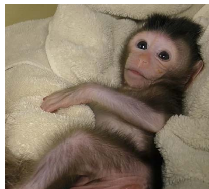
世界初の非ヒト霊長類動物での子宮移植後に出産された子ザル

有用であると考え、このモデル作製を試みました。カニクイザルでの手術はヒトと比べて非常に小さい個体であるため、繊細な技術が求められますが、長年に渡る産婦人科医と外科医の連携により、子宮移植手術手技を確立することができました。子宮移植後は拒絶反応（注4）を抑えるために免疫抑制剤を投与しながら、注意深い観察や管理を行いました。経過中に拒絶反応が認められることもありましたが、免疫抑制剤の治療により改善したため、受精胚を子宮内に胚移植して妊娠を目指しました。子宮移植手術から約1年後に妊娠が成立し、2回の流産を認めましたが、その後の妊娠では胎児