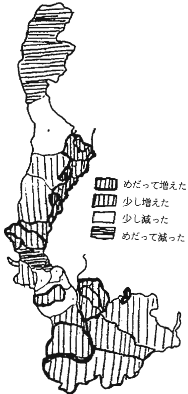
図 3 人口の動き (1980-1994) (『平成 6 年版 大津市統計年鑑』による)