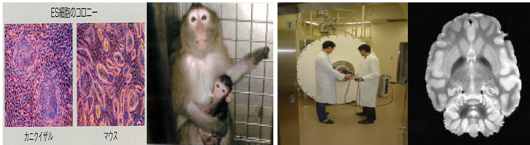
ES細胞・人工授精によるサルの誕生