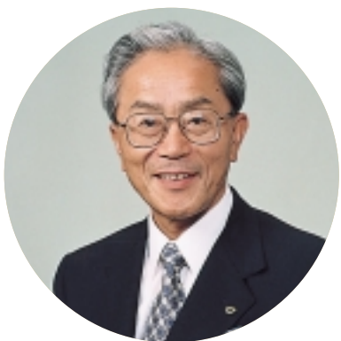
滋賀県知事 國松 善次